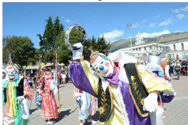
Figura 8. Payasos.

Son quienes ponen la picardía al baile, se encargan de transmitir alegría tanto a los que participan como a los que observan, llevan consigo una pandereta que la tocan en medio del baile y al final como símbolo de agradecimiento.