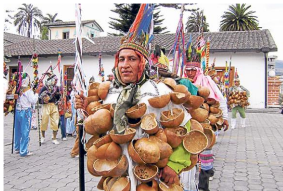
Figura 9. Yumbo Mate.

El personaje de Yumbo Mate se caracteriza por tener un traje compuesto por mates secos, el cual da ritmo y complementa al mamaco con el sonido del tambor y pingullo. Este no posee una careta o malla que cubra parcialmente el rostro, sino que se muestra como un indio Yumbo.