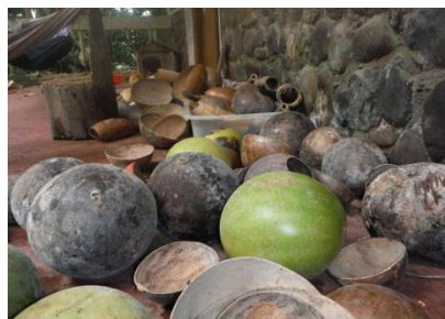
Figura 10. Bototo.

El Yumbo Mate viste un poncho con unos mates secos (Diario El Universo, 2013, noviembre) que son unos “Frutos de forma esférica o cilíndrica de un árbol denominado Crescentia Cujete que crece en forma silvestre en las zonas intertropicales”. Esto establece que, los mates que se encuentran en el poncho del yumbo son procedentes de este árbol también conocido como “Bototo” el mismo que crece en la costa y amazonía de donde son originarios los yumbos, utilizado como fuente de alimento y como utensilio de cocina.