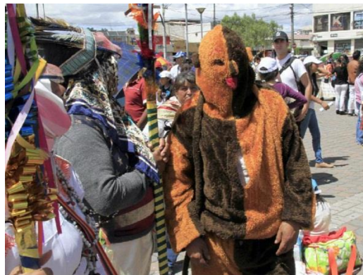
Figura 7. Mono Martin.

Es otro de los personajes principales dentro de la Yumbada, y es el único que no posee un nombre de montaña, como los demás yumbos, su nombre característico se lo define así “mono Martín”. Es quien se encarga de supervisar que el baile se lo realice de forma correcta, es decir alzando el paso, ni muy eufórico, ni tan lento, siempre siguiendo el ritmo que marca el tambor y pingullo.