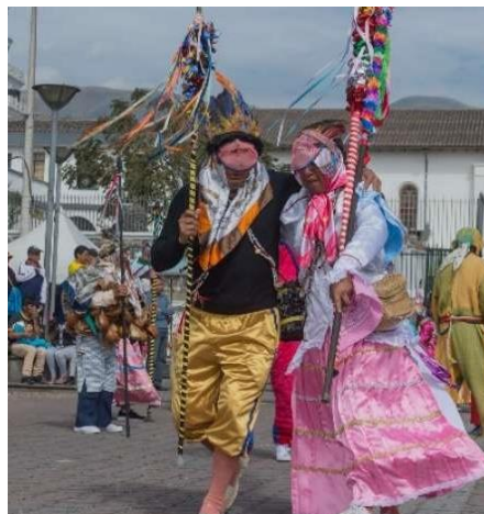
Figura 5. Yumbo Llucho.

Este puesto es ocupado solamente por los varones yumbos, quienes no posee un traje en específico, sino que usan una vestimenta común, de su diario vivir, con unas medias de color piel y el uso de un pantalón hasta las rodillas, para que se vean las medias, además de las alpargatas o zapatillas deportivas de color blanco. Lo que le diferencia del Yumbo mate, es que este personaje carga una chala, a un costado, y dentro de ella se encuentran cascabeles que aportan con otro tipo de sonido para la Yumbada.