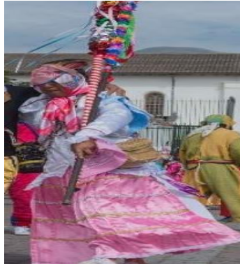
Figura 6. Yumba.