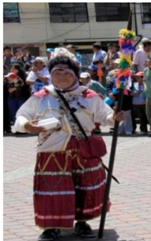
Figura 3. Cabecilla o Gobernador. Fuente: (Diario La Hora, 2015)