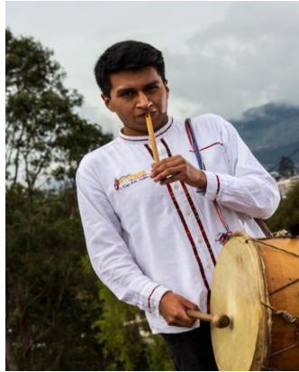
Figura 4. Mamaco.