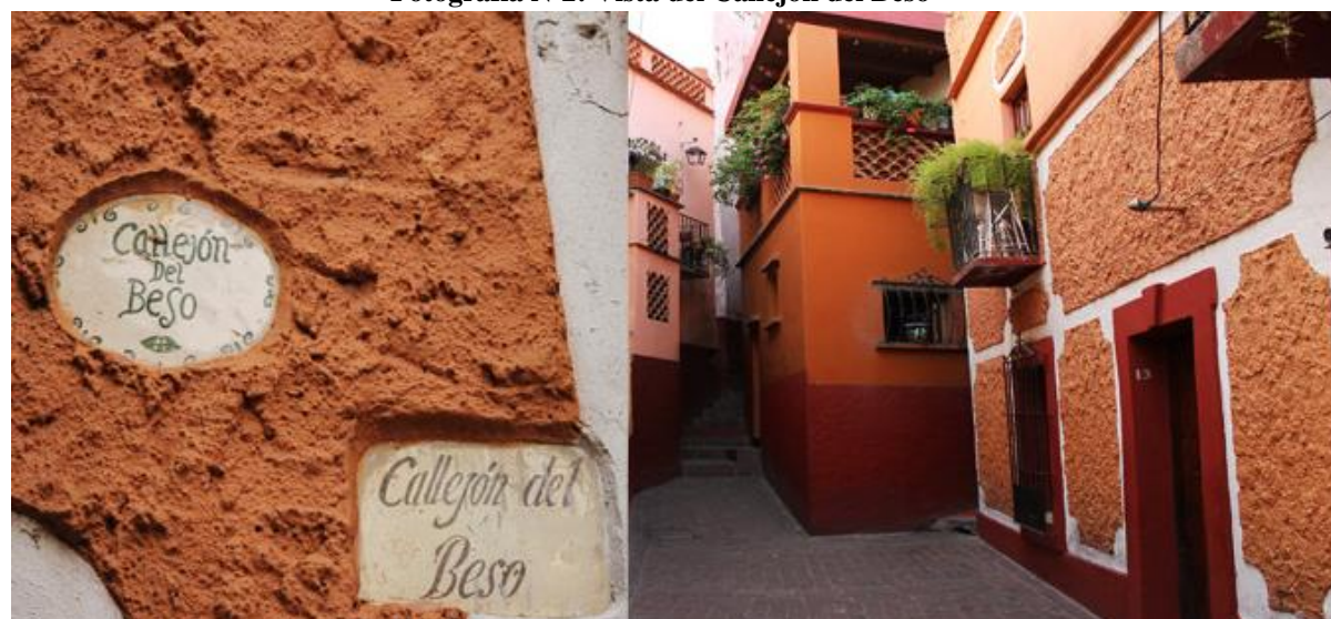
Fotografía N°2: Vista del Callejón del Beso

El callejón del beso, donde se puede apreciar la traza urbana irregular que aún se mantiene, ha adquirido una notoriedad turística por la estrechez del mismo, construido así por el curso encajonado del río, (Criterio II) (Fotografía 2).