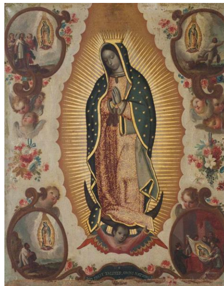
Fotografía N°4 Virgen de Guadalupe