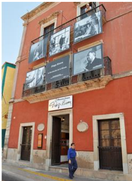
Fotografía N°3 Museo Diego

En el caso del Museo Diego Rivera, se toma en cuenta, no el contenido del mismo, que se asocia al destacado pintor Diego Rivera, sino a una casona del siglo XVII, que cumple con todas las características de las residencias de nobles, que están directamente asociadas a la fortuna de las minas, con elementos del barroco mexicano que se puede apreciar en sus ornamentos de cantera, como se describe en el criterio IV (Fotografía N°3)