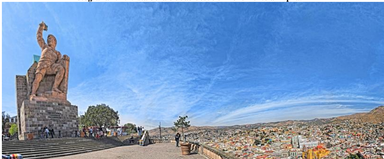
Fotografía N°1: Vista de la ciudad desde el monumento al Pípila.