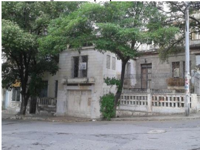
Figura 7. Fachada principal de la Casa nazi