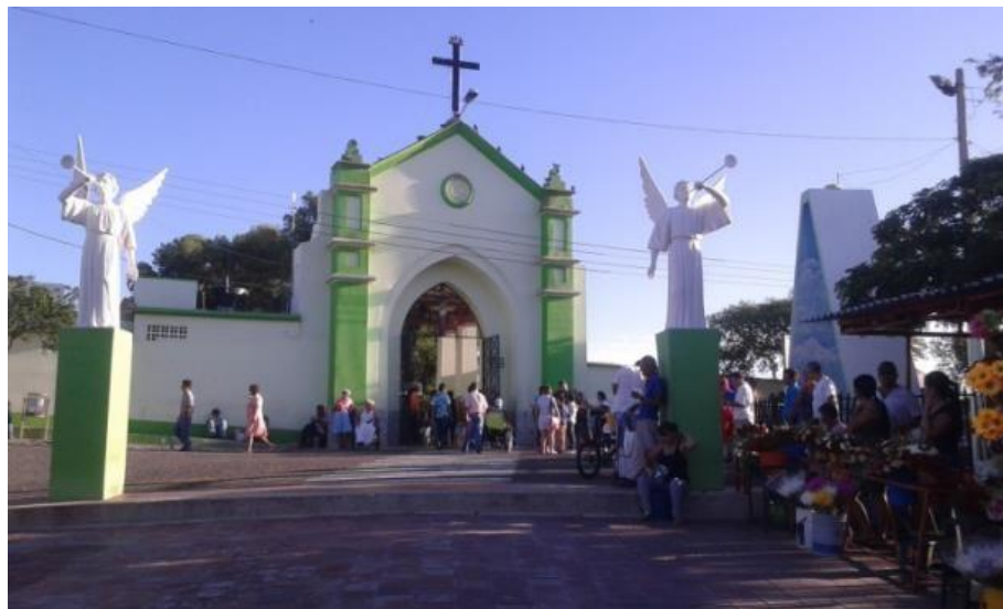
Figura 3. Fachada principal del Cementerio Central de Cúcuta.