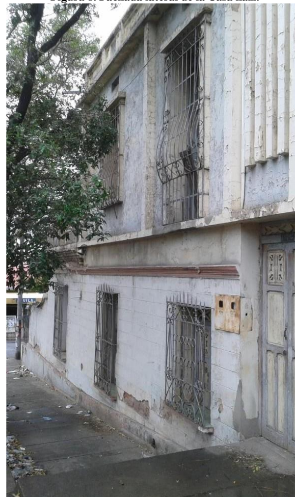
Figura 8. Fachada lateral de la Casa nazi.

Esta casa pertenece a los descendientes de un ciudadano alemán que llegó a Cúcuta en la época del fin de la Segunda Guerra mundial, por asociación entre los hechos acontecidos en ese momento histórico y el lugar de procedencia de este personaje, dentro de los habitantes cercanos a la casa se creó el imaginario de que se trataba de un “nazi” que huyó de Europa y se instaló en la ciudad para iniciar una nueva vida. A pesar de lo anterior, dentro de lo manifestado por la administradora del predio, son pocas las probabilidades de encontrar evidencia de relación entre el primer morador de esta casa y la ideología nacionalsocialista nazi. Mucho del mobiliario original que tenía la casa se regaló, también, una amplia cantidad de libros escritos en alemán, propiedad del primer dueño. Lo que si es cierto es que toda la arquitectura de la casa, ubicada en la esquina de la Avenida Sexta con calle 16, en la zona centro de la ciudad, cuenta con un diseño ornamentalmente ser atractivo, a pesar de su avanzado estado de deterioro; también tiene componentes constructivos que dan la apariencia de ser adaptados de los palacetes europeos.