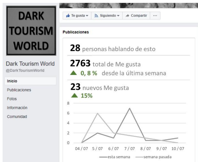
Figura 12. Fanpage de para simular una oferta de turismo oscuro en Cúcuta.

Parte del análisis realizado se validó a través de la red social Facebook. Se quería conocer el nivel de interés de las personas interesadas en Cúcuta como destino de turismo oscuro. Se utilizó la plataforma “Dark Tourism World” como punto de anclaje para la medición del interés, como se evidencia en la figura 12, el fanpage fue creado en el 2012 y las publicaciones se iniciaron el 4 de julio del 2016. El crecimiento de “likes” después de 10 días, a partir de la publicación de material sobre turismo oscuro, alcanzo 2.763 a nivel nacional e internacional, con algunos perfiles identificados de fotógrafos, artistas, académicos, antropólogos.