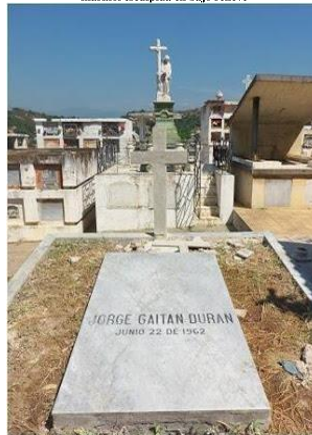
Figura 4. Tumba del poeta Jorge Gaitán Duran. Lamina de mármol esculpida en bajo relieve

También personajes como Enrique Raffo, quien ingresó y condujo el primer carro a Cúcuta en 1912 (el primer carro porque en Cúcuta nació Colombia), constituye un escenario y la oportunidad para conocer o repasar la historia de la ciudad.