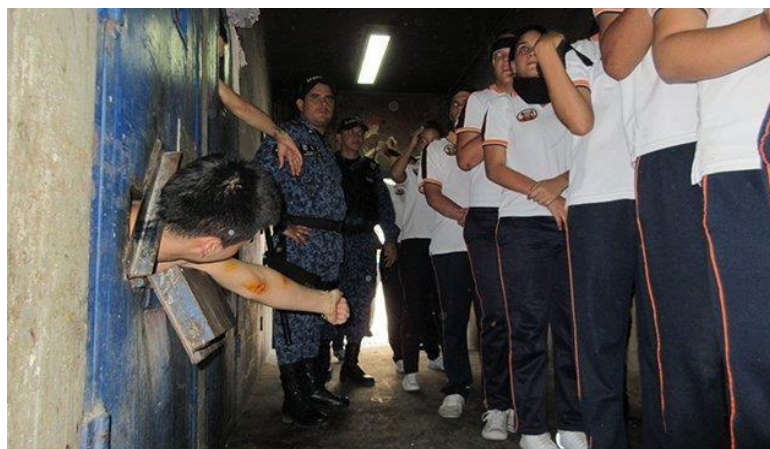
Figura 2. Presentación de recorrido Cárcel el Buen Pastor, Cúcuta.