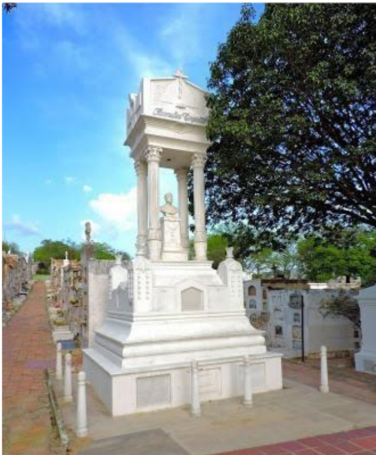
Figura 5. Mausoleo del poeta Enrique Raffo, una de las tumbas más grandes, mejor conservadas. Actualmente cuidada por los descendientes de la Familia Cogollo.