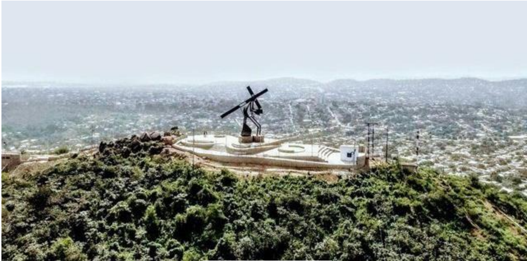
Figura 10. Cerro Nazareno, antes llamado cerro de la cruz. Imagen del mirador recientemente inaugurado.