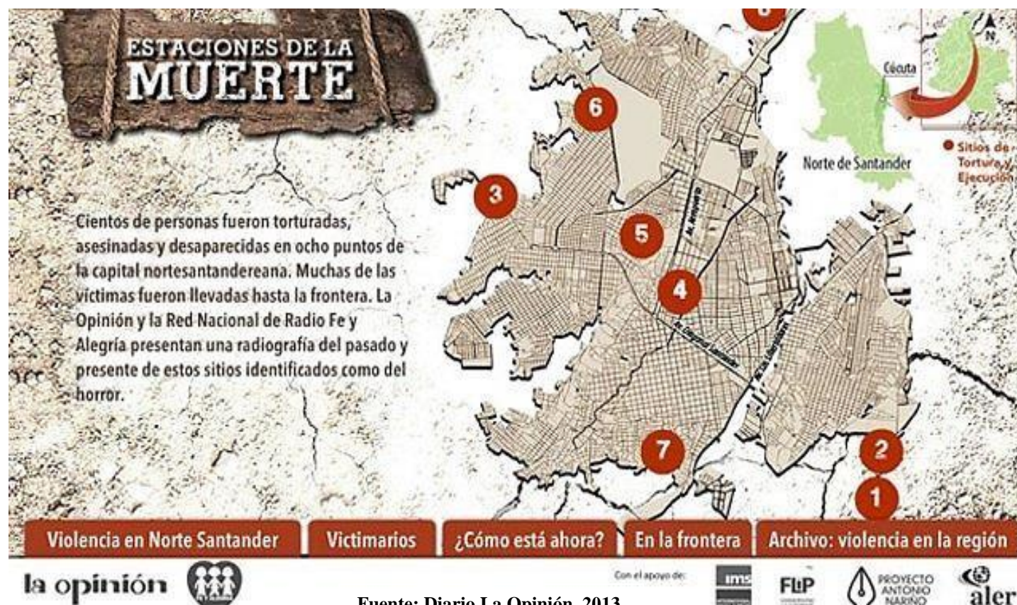
Figura 9. Estaciones de la muerte. Lugares en los cuales el paramilitarismo hizo presencia en la ciudad.