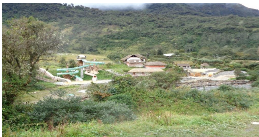
Fotografía N° 5 Termas de Oyacachi