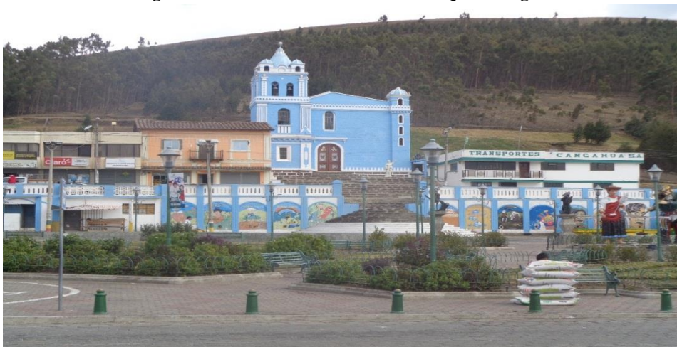
Zhunio, B. 2015

Desde Quito hasta Cangahua la carretera es de primer orden, de ahí hasta la población de Oyacachi el camino es de tercer orden, con muchas irregularidades, no