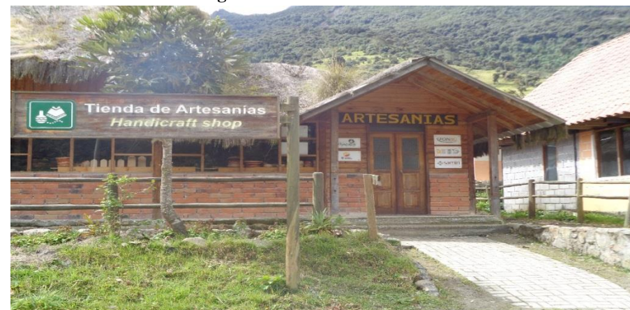
Fotografía N° 4 Tienda de artesanías

Esta es una de las actividades tradicionales que realizan las familias de la comunidad, elaboran principalmente utensilios y artesanías en madera; la materia prima para la elaboración de tales objetos la obtienen de los bosques circundantes, a los que cuidan adecuadamente, contribuyendo de ésta manera a la sostenibilidad de la actividad. El aliso ( Alnus acuminata ) es la especie forestal más utilizada. En los últimos años han incursionado en el pirograbado 8 y en el tallado de la madera, elaborando principalmente figuras que representan a la fauna local, siendo el oso de anteojos y el cóndor los más representados. Además, entre los productos obtenidos están las esculturas, elaboradas en los troncos secos de viejos árboles quishuar 9 , que tienen una altura de entre 4 y 6 metros. Los diseños en las esculturas incorporan elementos que identifican a la comunidad, sus tradiciones, la cosmovisión y la biodiversidad de la zona. Estos productos contribuyen al fortalecimiento del producto turístico, convirtiéndose de este modo en complemento. Son ofertados principalmente a los turistas, quienes a través de sus compras contribuyen al mejoramiento económico de las personas del lugar