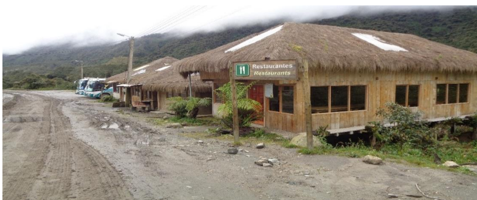
Fotografía N° 6 Microempresas de restaurantes en Oyacachi