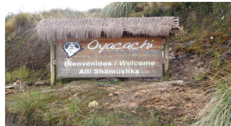
Zhunio, B. 2015

Oyacachi está emplazada al pie de la Cordillera Oriental de los Andes “en un valle que permite a sus habitantes tener acceso a productos de clima frío y cálido, mediante una diversificación considerable de su producto agrícola 3 , y es vía de entrada a la zona norte de la Amazonía Ecuatoriana.