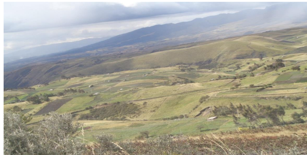
Zhunio, B. 2015

Hacia el Oriente de Oyacachi existe un camino de herradura (sendero) que conecta a la población con El Chaco, un cantón ubicado a 33 Km, en los ramales orientales.