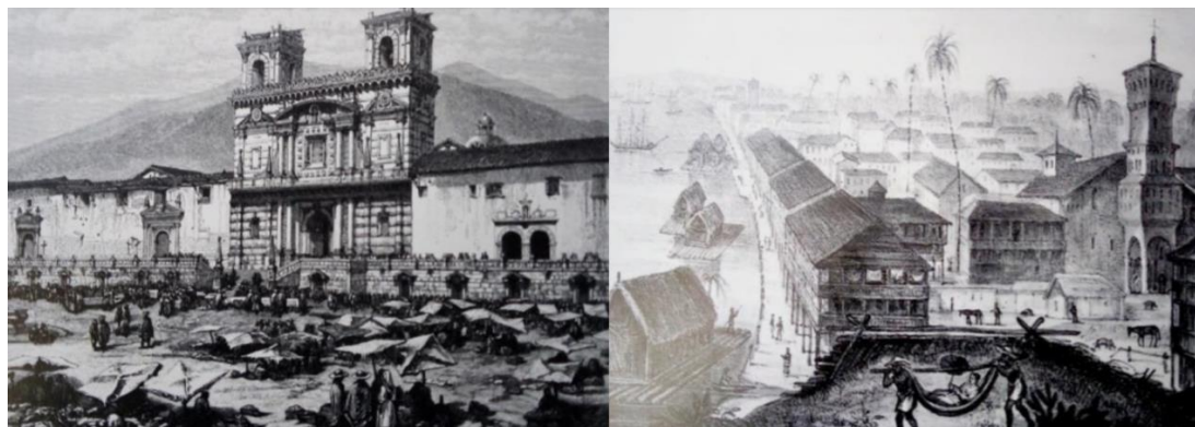
Figura 3. A la izquierda, vista de la Plaza de San Francisco en Quito. Diseño de Clerget y Ferdinandus según una fotografía. A la derecha, Panorama de la ciudad y puerto de Guayaquil junto al montículo de la Polvareda (Gaetano Osculati).

viaje. La escenificación del mismo sirvió como medio para difundir la empresa colonial y el proyecto “civilizador” (Ver Figura 3 ). El personaje más representativo en la proyección de la imagen del Ecuador hacia el mundo sin duda alguna fue Alexander Von Humboldt, quien a través de sus voluminosas obras influyó en viajeros como Charles Darwin, uno de los científicos de talla mundial más importantes. Un dato anecdótico de Humboldt es que en su pasaporte tenía registrado la inscripción “viajando para la adquisición de conocimiento”, dilucidando así su finalidad viajera (Fitzell, 1994). Otros que también generarían fuerte impacto en sus estudios sobre Ecuador fueron Charles Marie de La Condamine, Teodoro Wolf y Edward Whymper.