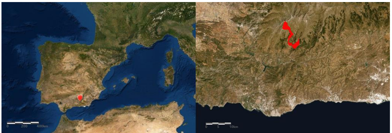
Figura 1. Localización de Bubión y su término municipal.

Bubión se sitúa en la provincia de Granada, en la comarca de La Alpujarra, concretamente en lo que se denomina La Alpujarra Alta. Pertenece a los pueblos del barranco de Poqueira. La catedrática de Historia medieval de la Universidad de Granada, Carmen Trillo, en un artículo sobre el poblamiento de las Alpujarras a la llegada de los cristianos, describió la Taha de Poqueira que actualmente componen Bubión, Capileira y Pampaneira (Trillo, 2009). Situada en la vertiente meridional de Sierra Nevada, Bubión se ubica entre Capileira y Pampaneira, a unos 1.300 metros de altitud 4 . Para concretar sus características me remitiré a la literatura clásica (Fontboté, 1957; Bosque Maurel, 1971; Rodríguez, 1985).