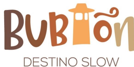
Figura 3. Logo Bubiión Destino Slow

Durante la elaboración del PLT las mesas de trabajo también participaron en el diseño de la marca turística, primero cumplimentando un cuestionario y después eligiendo la imagen definitiva y el eslogan del municipio. Esta nueva identidad estaba llamada a convertirse en una invitación para disfrutar del entorno natural, histórico, patrimonial y auténtico de forma calmada.