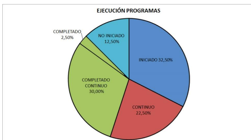
Figura 5. Ejecución de programas. Leyenda: Porcentajes de la ejecución del Plan Local de Turismo por la Calidad de Vida “Bubiión Slow”.

Como se puede comprobar, el grado de ejecución de los programas es alto con un 32,5% completado, un 22,5% continuo y un 32,5% iniciado. Hay que destacar que todos los programas se han iniciado. En el ecuador de su implementación, el 87,5% de las acciones programadas se han trabajado, como se desprende de la documentación analizada y de las entrevistas a los técnicos del Ayuntamiento de Bubiión.