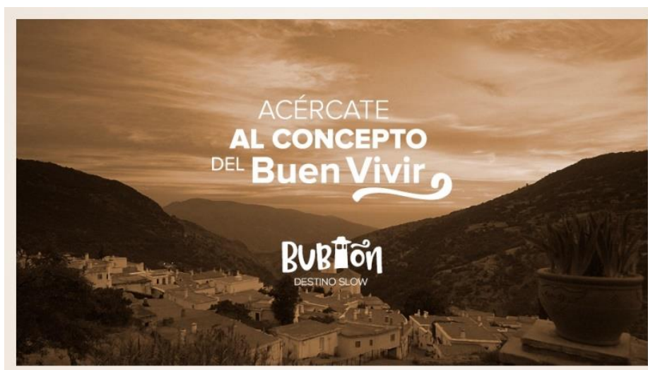
Figura 4. Eslogan del municipio.