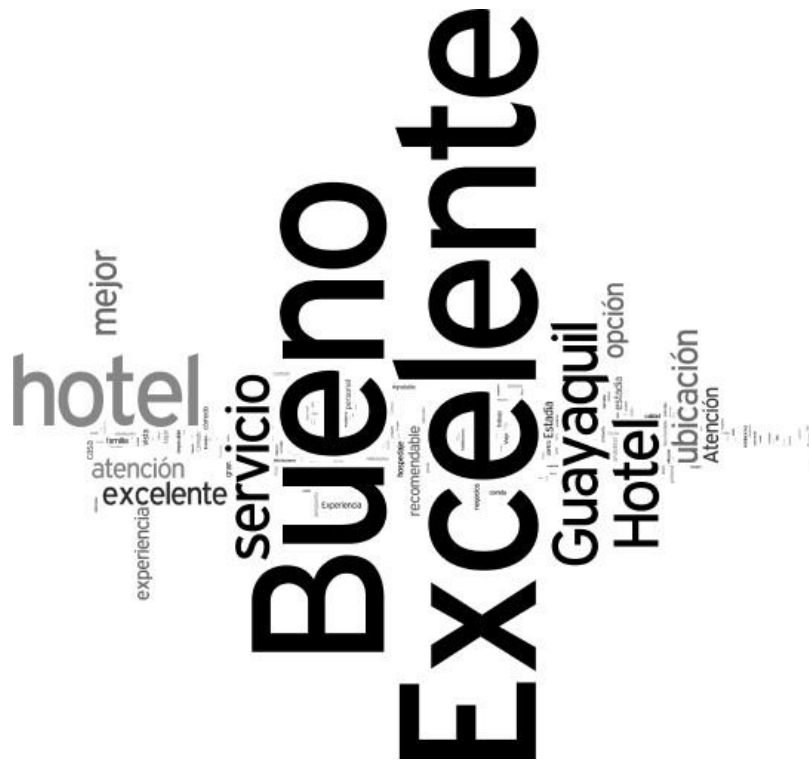
Figura 3: Nube de palabras de los títulos de comentarios revisados en TripAdvisor .